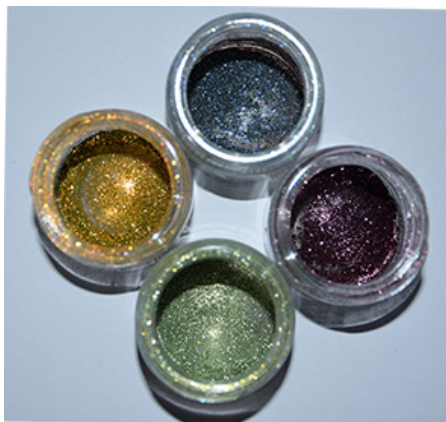
Poudres de silicium poreux colorées